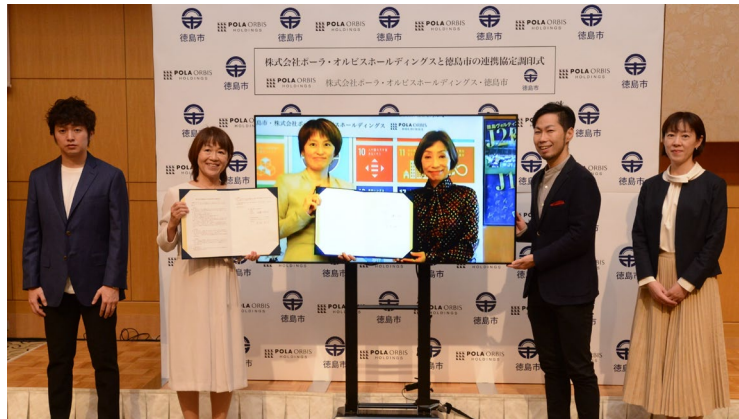
横浜の会場と徳島市役所をウェブ会議システムで結び調印式を実施

※2 「ポーラ化成、ウェルネステックプロジェクト“me-fullness”をスタート」(2021年7月2日) http://www.pola-rm.co.jp/pdf/release_20210702.pdf